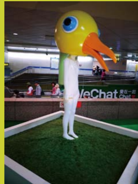
設置在台北捷運車站的公共藝術。