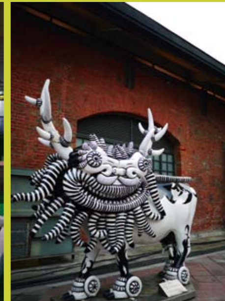
彩繪圖騰式的公共藝術。