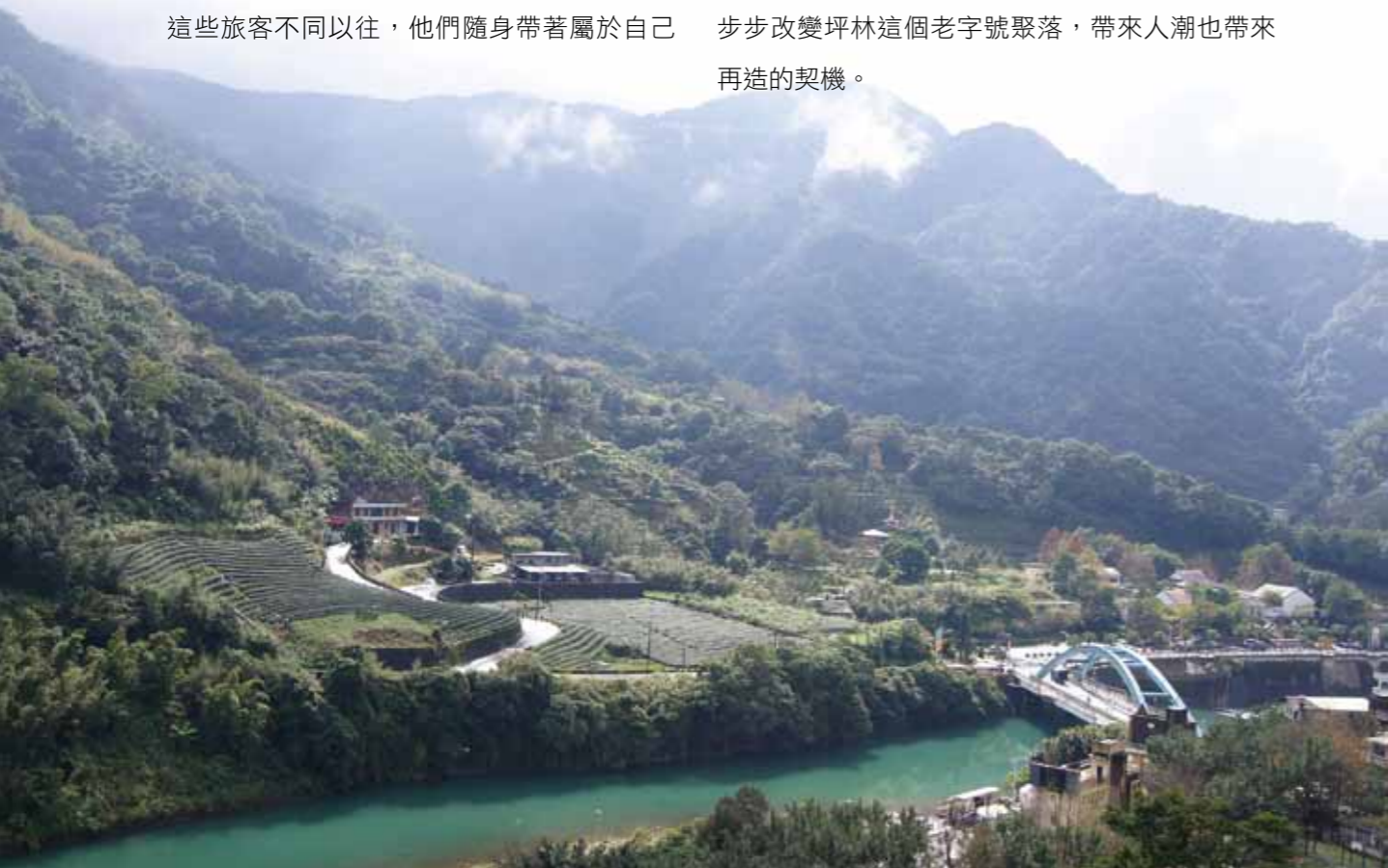
坪林隨處可看見大片茶園立於眼前。

低碳，多麼「潮」的字眼！這個新詞彙正一步步改變坪林這個老字號聚落，帶來人潮也帶來再造的契機。