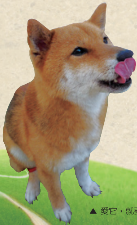
▲ 愛它，就要好好照顧它一輩子

之後的求學生涯中，我與動物的相關連大概就只有自然課或校外教學會接觸到的甲蟲、蠶寶寶、魚標本，還有校狗、校貓，以及朋友家的寵物，也未再興起想要養寵物的念頭。直到念研究所時，幾乎班上每位同學家中都有寵物，想要養寵物的想法又漸漸萌發。某天經過寵物店，看到一群可愛的小兔子在籠子裡探頭探腦的，好不可愛。我跟某隻兔子就像看對眼似的，我看著它，它看著我。當下我就決定，不管爸媽怎麼反對，也要冒著會被趕出家門的風險把它帶回去！拎著兔子、籠子、飼料的我到了家門口掙扎了許久，還是硬著頭皮開門，把我的寵物帶回家！