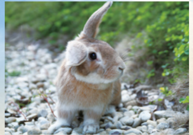
▲ 好好照顧兔子，它也可以陪你走過10年的歲月