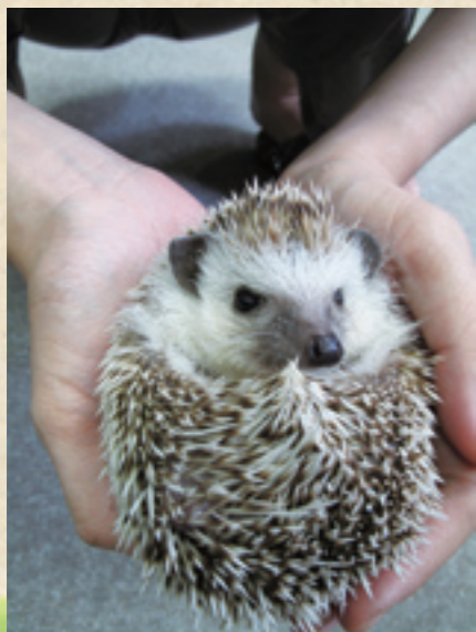
▲ 寵物可愛的模樣，讓主人甘心為它們付出