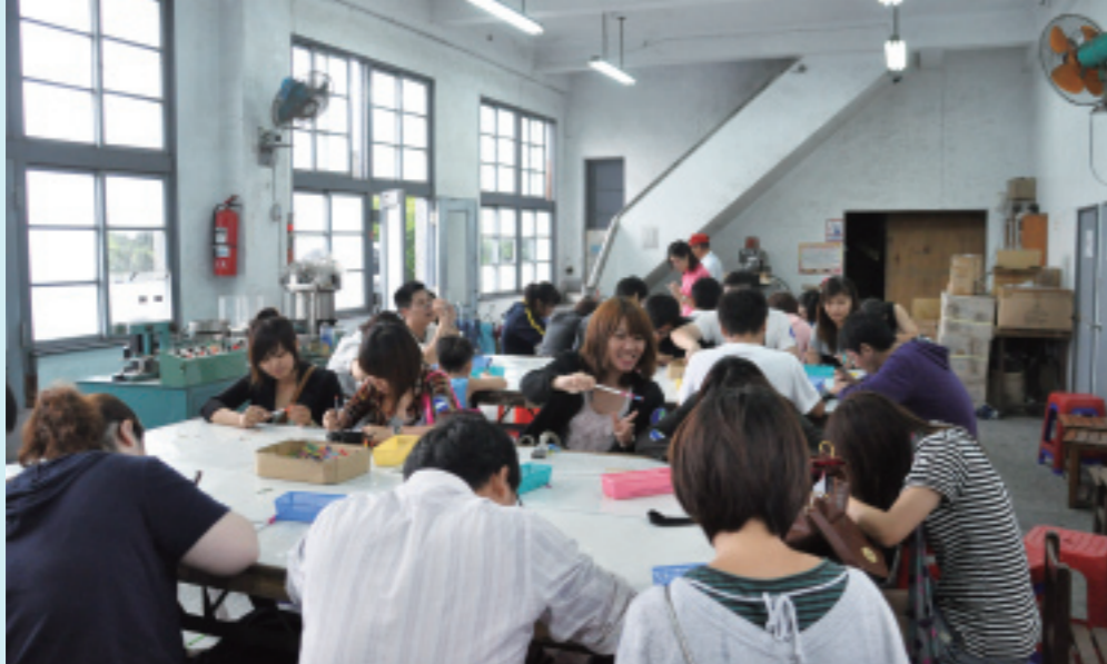
▲ 大家努力的製作屬於自己的鉛筆

鉛筆、自動鉛筆、魔術鉛筆…等，但傳統の木製鉛筆卻仍然生存了下來，筆桿自然散發出森林的氣味和書寫時的順暢感覺，這些僅有鉛筆具有的特色，都是不可被取代的優勢。