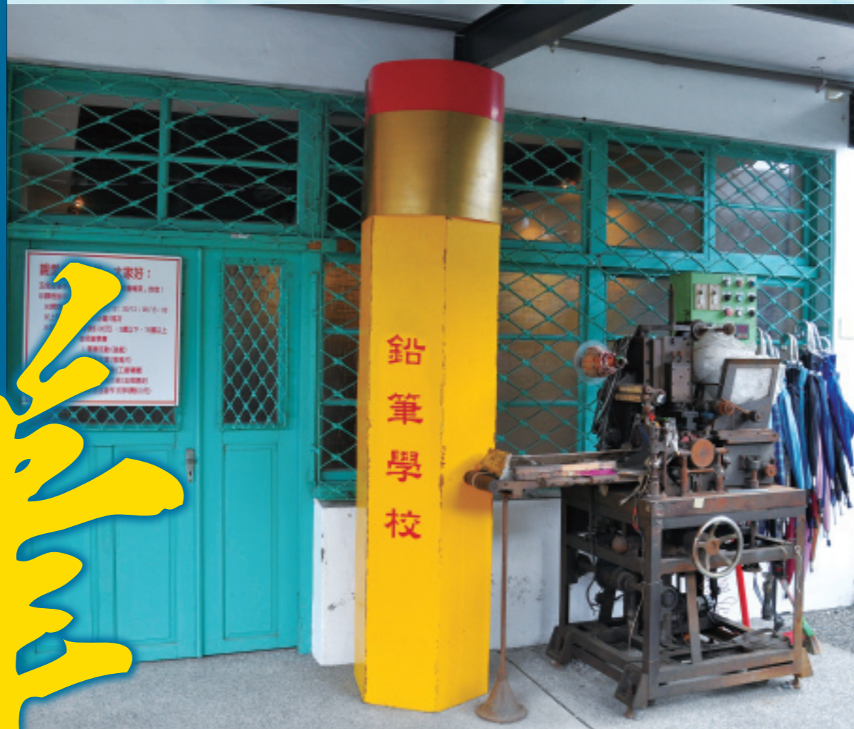
▲ 鉛筆學校門口，擺放了六角黃桿的經典鉛筆模型