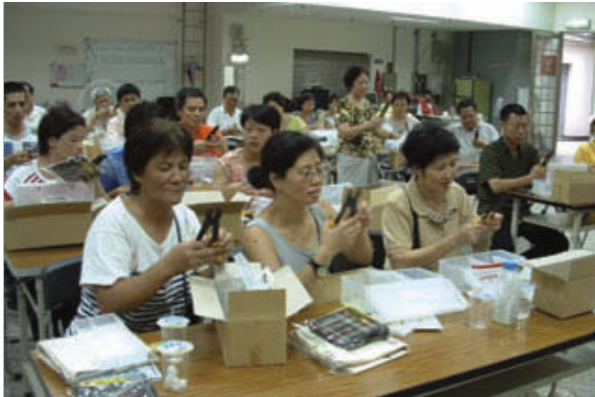
媽媽們踴躍參加屋內設備簡易修護班。

最常見的是，小朋友們不僅身體力行，也會提醒家中大人隨手節能，成爲家中節能的小尖兵。也唯有真正的落實與往下紮根的節能態度，從小教起，從家庭做起，才是根本拯救地球的方法，到底我們只有一個地球。