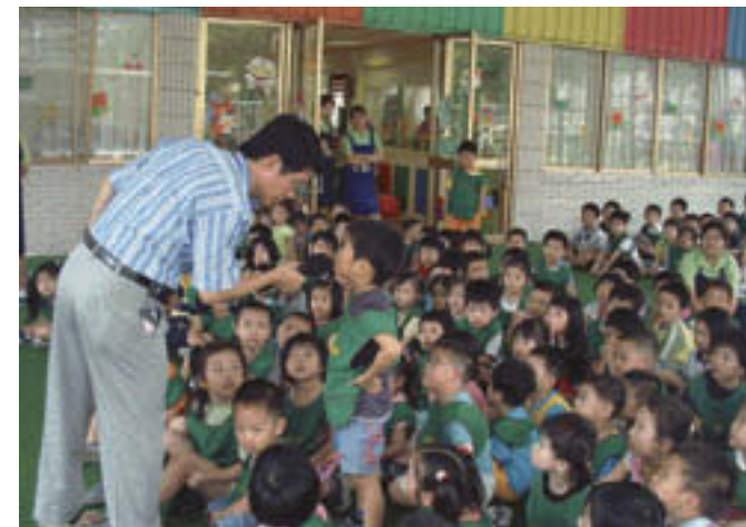
幼稚園小朋友搶著回答有關節能的問題。

其次，持續追蹤國際能源的發展趨勢並參與國際合作及海外投資計畫。積極建置盤查排放量的技術與資料庫，未雨綢繆提前制訂二氧化碳減量策略，善盡地球生態保護義務。