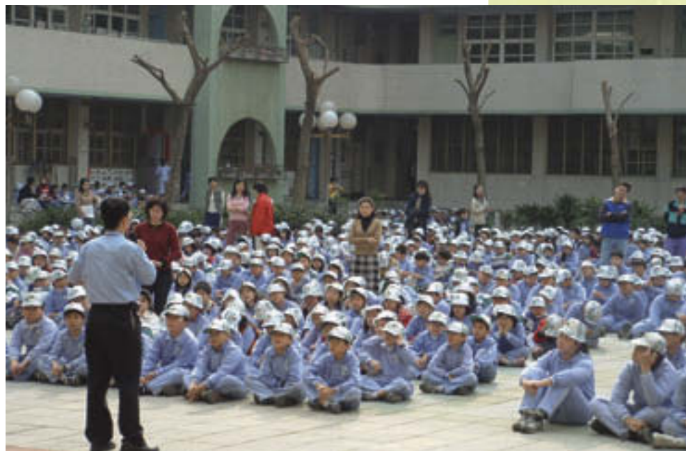
台電各區營業處每年固定到轄區內的學校和小朋友談能源節約。

由於電能輸配方便，容易轉換為光能、音能、熱能或動能，所以長久以來電能一直是一般大眾生活上最依賴的能源。提供經濟、充裕、穩定、質優而便宜的電力，以滿足經濟發展及民生用電需求，始終是國營公用事業台電公司責無旁貸的責任與使命。所謂「光被八表，利溥民生」是六十年來台電企業經營的寫照。