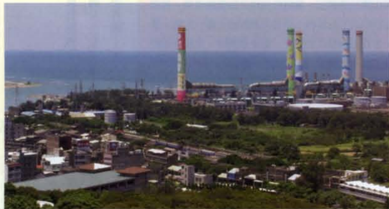
苑裡鎮位在通霄發電廠周邊，雖受到一些影響，但鄉鎮發展也獲得電基會的大力協助。

苑裡位在通霄發電廠周邊，和電廠一直維持良好的互動關係，張鎮長對於電基會地方協助金，抱持非常肯定的態度：「原本鎮庫就缺乏，由於財稅劃分的緣故，向中央要不到經費，縣政府本身財政也十分困窘，幸好還有電基會的