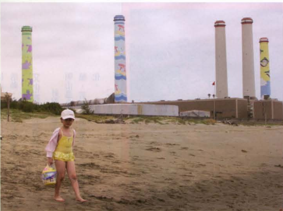
在珍貴的基礎上，居民對通霄文化的認識，自清晨起，在珍貴的基礎上，居民對通霄文化的認識，自清晨起，在海邊浴場，陪小女兒來玩水。

業，讓不同區域的文化有交流的機會，通霄演藝廳扮演的其實是一個窗口的角色。邱紹俊說：「推文化，的確是很辛苦。許多表演團體願意半價收費到通霄來，如朱宗慶打擊樂團。有一次配合拱天宮活動，臨時邀請居然馬上就答應，而他們第二天就要出