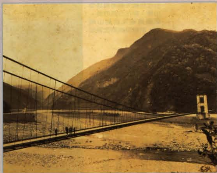
大濁水溪(和平溪)上的鐵線橋