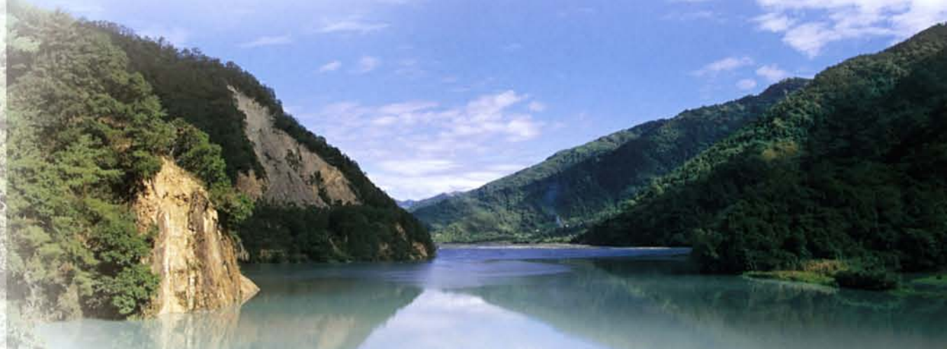
▲景色秀麗的武界水庫