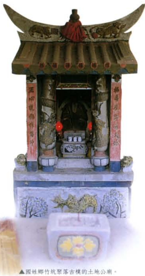
▲國姓鄉竹坑聚落古樸的土地公廟。

國姓，一個以客家人為主的鄉鎮，過去一直沒有人在地方上推動文史調查的工作，因此諸多珍貴的地方史料就這樣隨著歲月煙滅或者被冷落；如今這些有點年紀的社大學員們，懷著初生之犢的勇氣和熱情，從學習轉而耕耘，從陌生生進而投入；