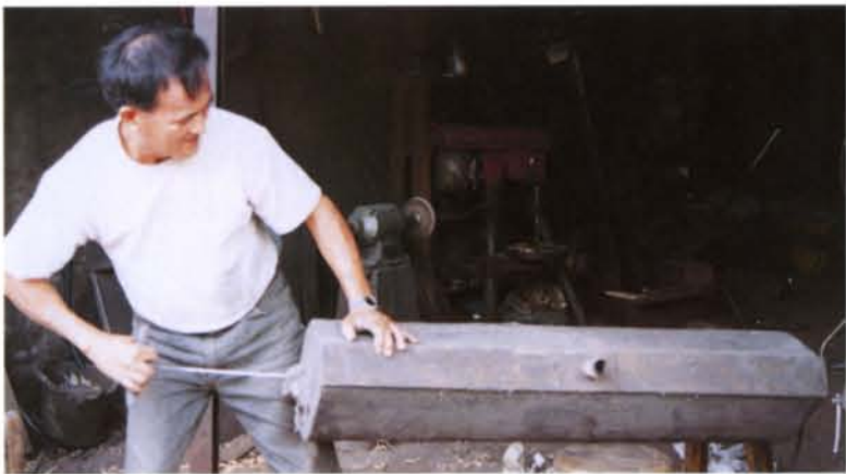
家傳光緒年間祖父使用的鑄鐵手推鼓風機。