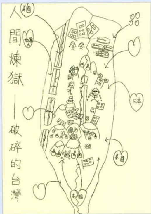
繪圖／王堯漢（土城安和國小六年級）