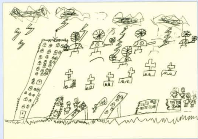
繪圖／凌凱怡（板橋板橋國小五年級）