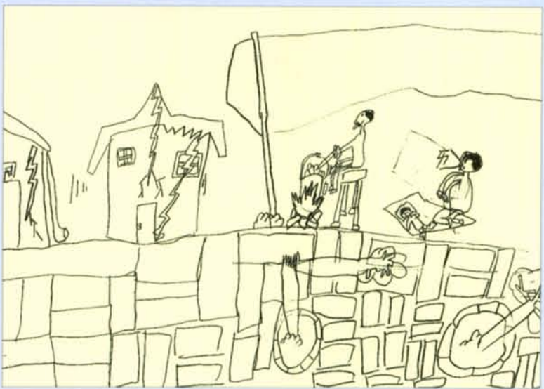
繪圖／周秉厚（板橋海山國小三年級）

來了一個很大的餘震，忽然，碰的一聲，我想書桌上的裝飾品，會不會破掉，之後，又來了許多大的餘震，使我一夜不敢再睡覺。