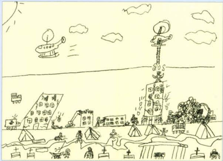
繪圖／邱鴻明（土城安和國小四年級）