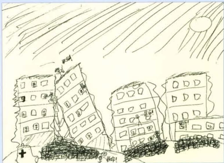
繪圖／王樂楨（板橋海山國小六年級）

人生短暫，每活一天，就該慶幸一下，又可以再作許許多多的事，如果今天是我們要在操場上睡覺，使用別人救濟的物品，學校塌了，還有什麼地方能求學？我們該去幫助他們，才能使他們重現希望。地震當時，整個臺灣都醒了（雖然還是有人正在呼呼大睡），但有許多人不覺得是地震，有人覺得是中共放飛彈來了，還有人更離譜，例如：我的表哥，他覺得床在搖，可能是上舖的人在搖床（他是住校的），他又看見燈慢慢的暗下來，電風扇也停下來了，他不知道是悲慘的事來了。