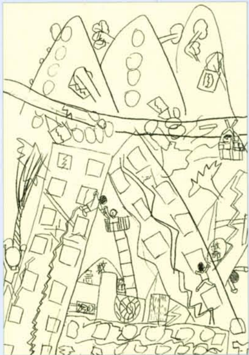
繪圖／周秉萱（板橋海山國小三年級）