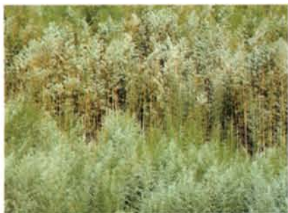
▲樹，不是生來讓人利用的，它是與人和平共存的。

的日子才能成材，終於明白，樹不是生來讓人利用的，它是與人和平共存的；森林愈原始的地方，人活得愈好，它提供了氧、水、清新的空氣，與一套循環不息的人生哲學。