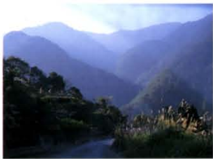
▲親近自然與追求綠色經驗的心情，每個人都有「原生性」的強烈。

由於日子太忙，這些韜光斂影早就淡出眼界，渾然不知原來美可以如此近在咫尺，以為美麗是必須用錢兌換的，於是迷戀歐洲七天十一國遊，慌慌張張的走完行旅，但卻一點心也沒放在身上；終於明白，美是需要用「心」迎接的，只要有心，處處是美景。 隨著季節與時間的流移，美也跟著幻化莫測，路旁細微的變化是一種等待發現的驚奇，河畔的芎芒花盛開，沒有餘暇的人看不出這樣的美感，蝶與蜻蜓早已翩翩飛起，在盛夏的土地上吮吸早晨的雨露。 美對我來說，成了愈來愈近的作品。