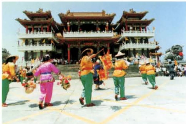
▲每年中秋節來自全省土地宮廟的慶賀。

繞境的隊伍一出發，鞭炮震耳。每逢農曆八月十五日，全國土地公來慶賀。土地公的壽誕前後，在大鼓陣的造勢之下，八家將、宋江陣、踩高蹺，連同各村落的神轎也一起巡境，乍成一片旌旗飄揚，威風凜凜。