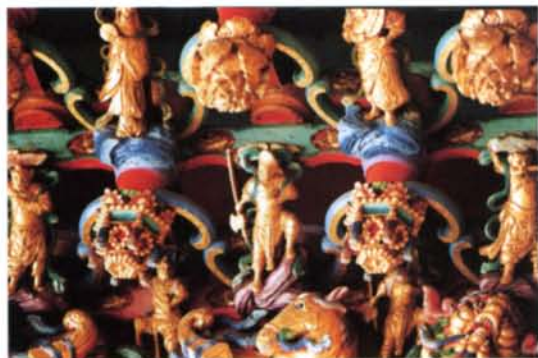
▲福安宮裡，處處可見精緻木雕。

那是光緒年間的事了，西元一八九〇年的秋天，福安宮內的大爐突然「發爐」。藉由乩童旨諭，要村民在三天之內慎防災禍發生。果然，車城鄉下了有史以來的大雨，傾盆的水帶動了山洪的暴漲，沿川行下狀若排山倒海。