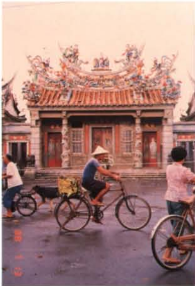
▲改建前之福安宮。