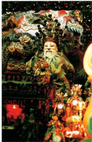
▲頂戴宰相帽的土地公。