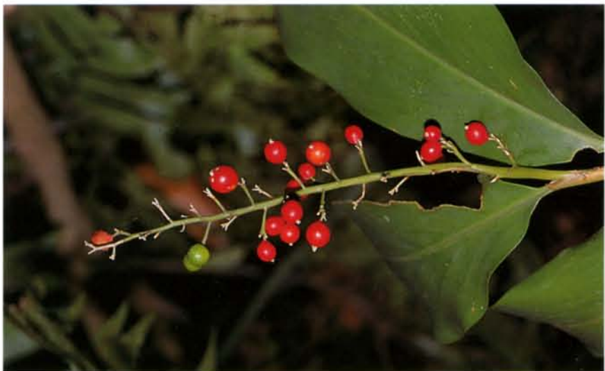
◆ 古道上常見可愛的小月桃。

愛富三街走到底，向右轉不到三百公尺，左邊有一條清楚的石階小徑，就是入口。有人稱為天母古道，當地人則稱之為水管路。銜接處右邊也有一條路通往水源地。如果不往下走石階小徑，繼續沿柏油路下行，過了磺溪上游的石橋，迎面而來的是紗帽山邊的陽投公路。