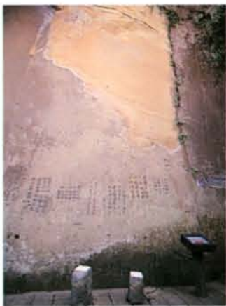
▲著名的地標大石壁。

要進出口，分別在靈雲宮、市立療養院和松山喬職。 若由靈雲宮進入，從登山口便鋪設了寬敞的石階步道。抵達第一處步道分叉路時，立有解說牌，告知南港山系和四獸山系的分佈地圖位置，以及象山和虎山自然步道的範圍和路線圖。 如果往永春公園的方向前行，一路隨著雅緻的石階步道前行。石階旁都有佇立的解說牌，解說現場的環境植物。譬如，前面幾個解說牌分別提到了水同木、大花曼陀羅等。前者是潮溼植物的指標，後者是有毒的植物，解說牌都清楚地敘述植物的特性。如果不滿足，還可以攜帶一本野花野草之類的圖鑑輔助。 象山步道旁植物群相緊貼著步道，種類豐富而繁多，非常適合自然觀察的解說。大體上，在林子裡的植物最初的優勢植物是台灣山香圓，接著是偏向潮溼環境的九節木為多。 抵達永春亭後，至少有三個方向的去路，在此，建議你繼續往上走，按著刻有「象山自然步道」的石階繼續前行，旁邊的坡地上有許多栽植的小樹苗和白色小牌，這些小樹多半是