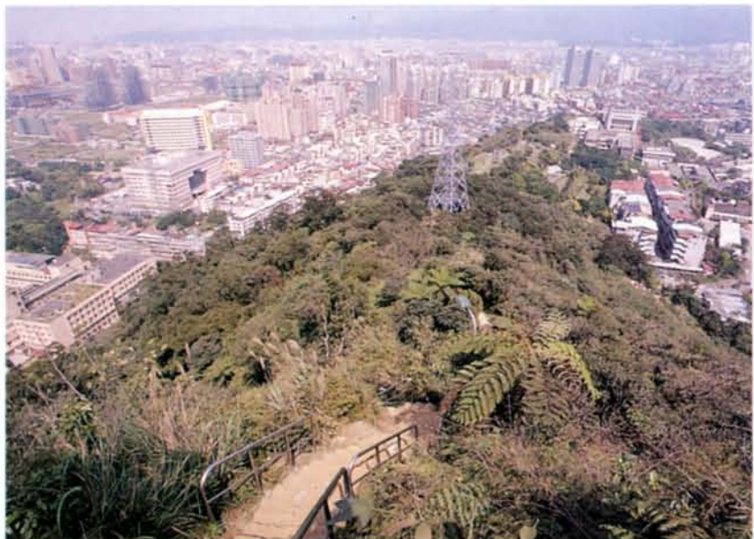
▶由象山鳥瞰東區頗具後花園之感受。