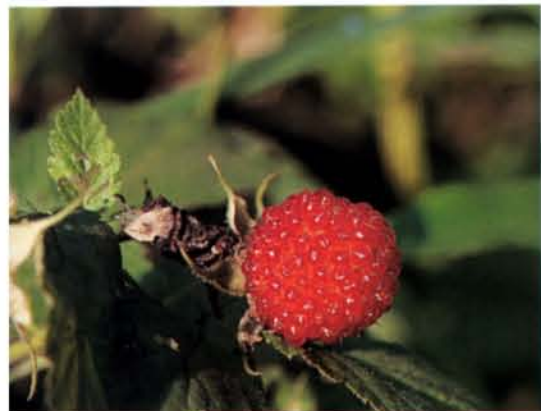
◆步道旁春天時常見可食的刺莓結果。

目前象山地區，已將過去登山人常常攀爬的山路，重整出完善的自然步道。在台北諸多環山的自然步道裡，象山算是規劃最為完善的一條，平常晴朗時日，登山者即絡繹於途。不僅路途寬敞便利，沿途也都設立簡易的木製解說牌，幫助市民認識整個山頭的特色。 通常一般市民進入象山，有三處主