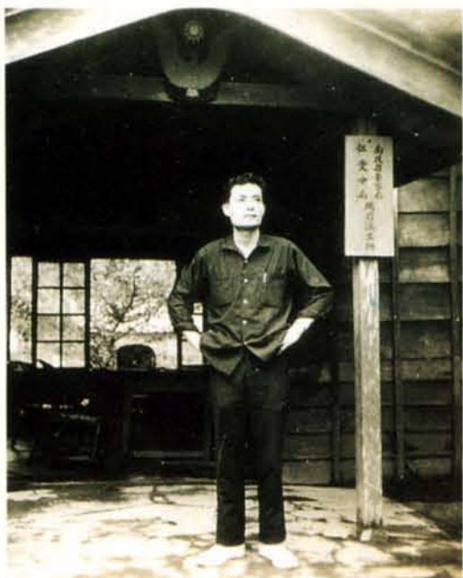
◆這是爸爸在山上當派出所警員的模樣。

這一撞，使我深感爸媽呵護之深切。也使我知道生活不是只有自己。而平安踏實的人生才是最可貴，最該值得我們慶幸珍重的。 *