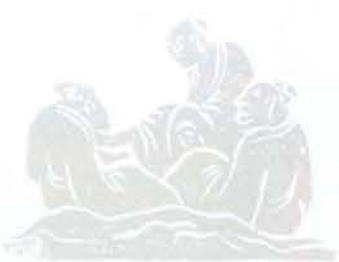
◆金門宗祠樑板雕飾精美。

為單位，作單色刷染，若為免單調至多於柱頭加「裝鑿」。量體小者如斗拱、椽條，多以「面」為單位，作單色刷染，例斗拱六個面用一至二色，色面間以第二種顏色鉤描，增加視覺效果，例山后王氏宗祠之瓜筒紅底間以金綠鉤勒精緻美觀。量體中者，表現有凹凸綠腳的