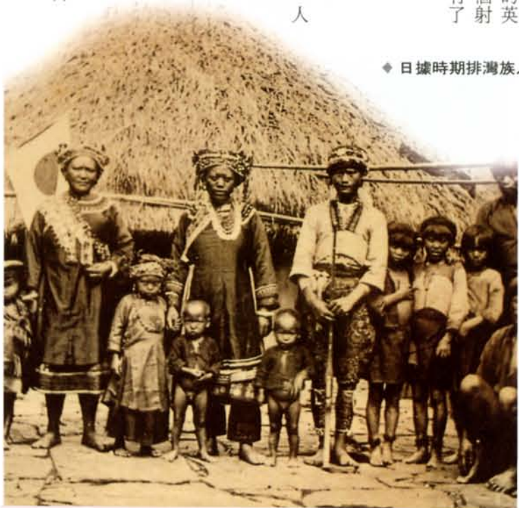
◆ 日據時期排灣族人。