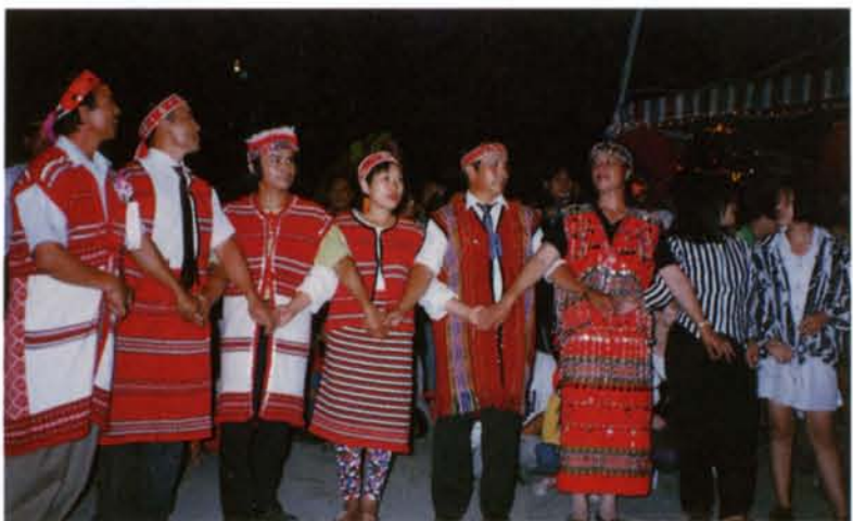
◆賽夏族人穿傳統服飾跳矮靈祭。