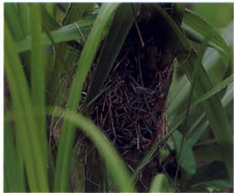
◆褐頭鷦鷯利用葉絲築巢。

體說來，棲息在郊野林中的小鳥，在築巢時，很少不用到芒草的。 在昆蟲方面，昆蟲學家都知道，至少有一種椿象，以芒草為一生的食物。從幼蟲起都生活在芒草的葉片上；大型的黑山蟻群更常三五成群，聚集在葉片上吸食葉汁。 到了晚秋，出名的紅圓翅蛾形蟲，也三兩成群出沒於芒草上，似乎對這種草莖的汁液情有獨鍾。秋天瘦小的鐘胡蜂族群，顯然也喜愛把這種植物當做家屋。 總之，一株芒草不僅對人類而言，全身幾乎都有用途，對多數的鳥類和昆蟲亦然。一種植物多種動物受惠，像這樣的植物還真不多見。