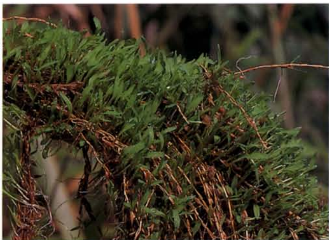
◆春天時，許多幼苗長出，如小麥草般美麗。

第四個階段在初春時，芒草只剩殘破的枯稈挺立，垂著細鬚的枝條，襯托著淺綠的葉子。但是在一些裸露