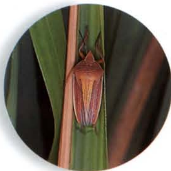
▲芒椿象一生寄居於芒草上。