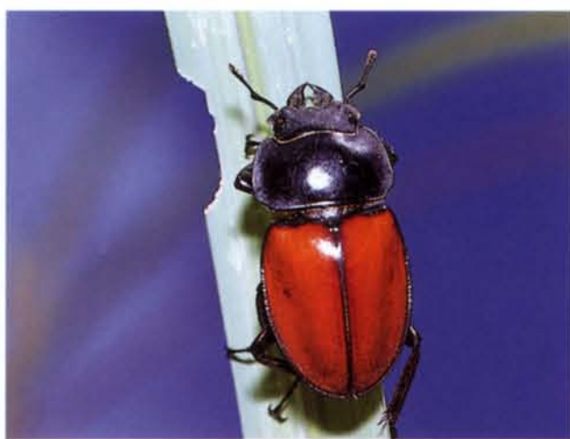
▶秋天時，紅圓翅蛾形蟲常出現於芒草上。