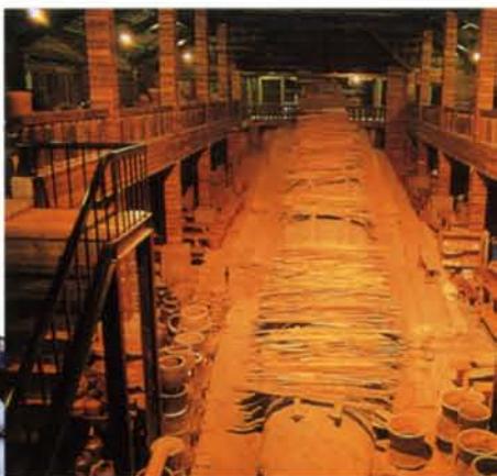
●瞧瞧！「土巨蟒」的窯內可真溫馨，歡迎您一起來烤地瓜。

蛇穴，恰似它的名字，林間小徑帶著我們走入這個洞天，啾！原來青山綠水的深處，就是陶的故鄉。