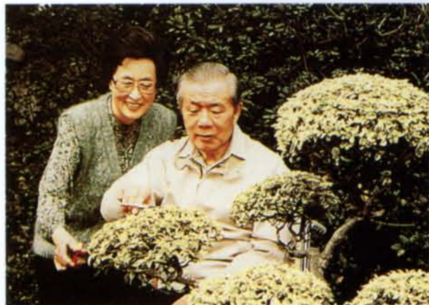
◆賢慧的雙手，牽伴著生生世世的情。