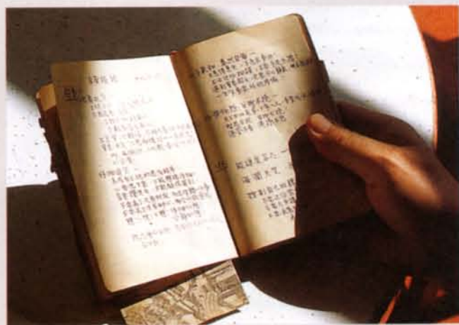
◆沉重的手，翻起點點滴滴的往事。

第一波寒流來襲的傍晚，繁榮的台北處處亮起燈火，柔和的光線，為灰暗的天空增加絲絲暖意。前往訪問孫資政的路上，倏地發現台北的街頭，正飛揚著各式的競選旗幟，商家閃爍的霓虹燈，映著這些繽紛的色彩，使得車水馬龍的市容顯得格外的特別。五十年前，孫資政負起修復斷垣殘壁中的台灣電力設施，繼之從政入閣封卿拜相，宦海奔波，不但點亮了億萬家燈火，更導航了台灣奇蹟，這位備受推崇的布衣名相，走過從前，但是他的風範却持續溫暖的照亮寶島的每一個角落。