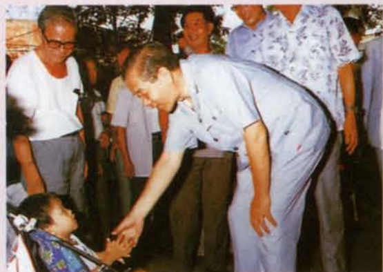
◆無時無刻握住國家幼苗的小手。