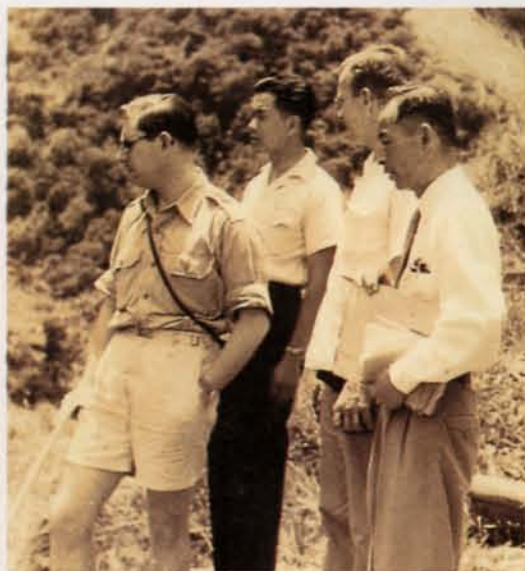
◆ 僕僕風塵，放眼天下。