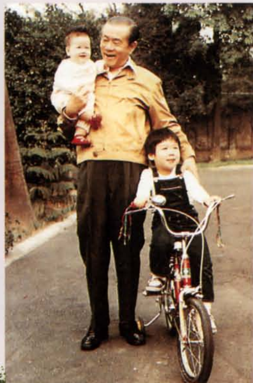
▶日理萬機中，偷得浮生弄孫樂。