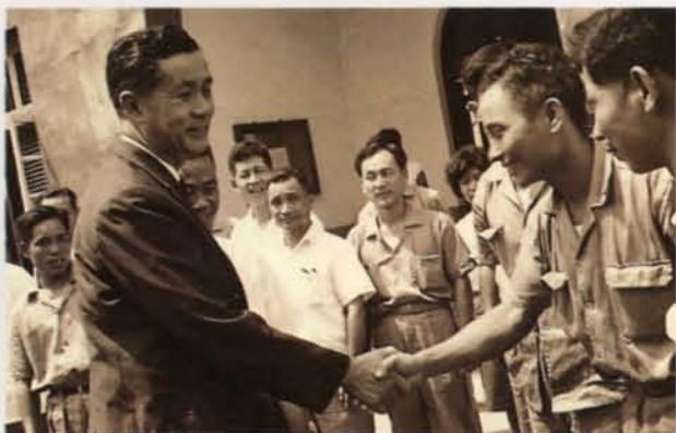
▼ 明燈照亮前面的路，啓迪員工的智慧。